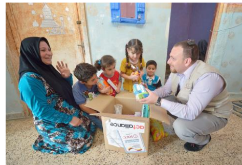
Een gezin ontvangt een pakket

Dit project zet ook aan tot bezinning. Een vraag die al snel opkomt: Wat is de positie van kerken in het Midden-Oosten, de bakermat van het christendom? Hoe is het om kerk te zijn in een minderheidspositie? Naast praktische hulp en collecten gaat de projectgroep hier ook mee aan de slag.