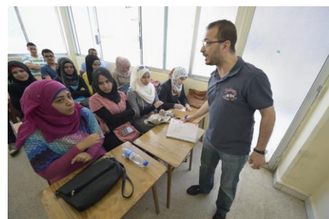
Onderwijs aan vluchtelingen

Onder deze vluchtelingen zijn christenen. Hoe kunnen en willen zij kerk-zijn in onze stad? Zijn contacten met onze kerken gewenst? Zo ja, hoe brengen we die tot stand en welke invulling geven we er dan aan?